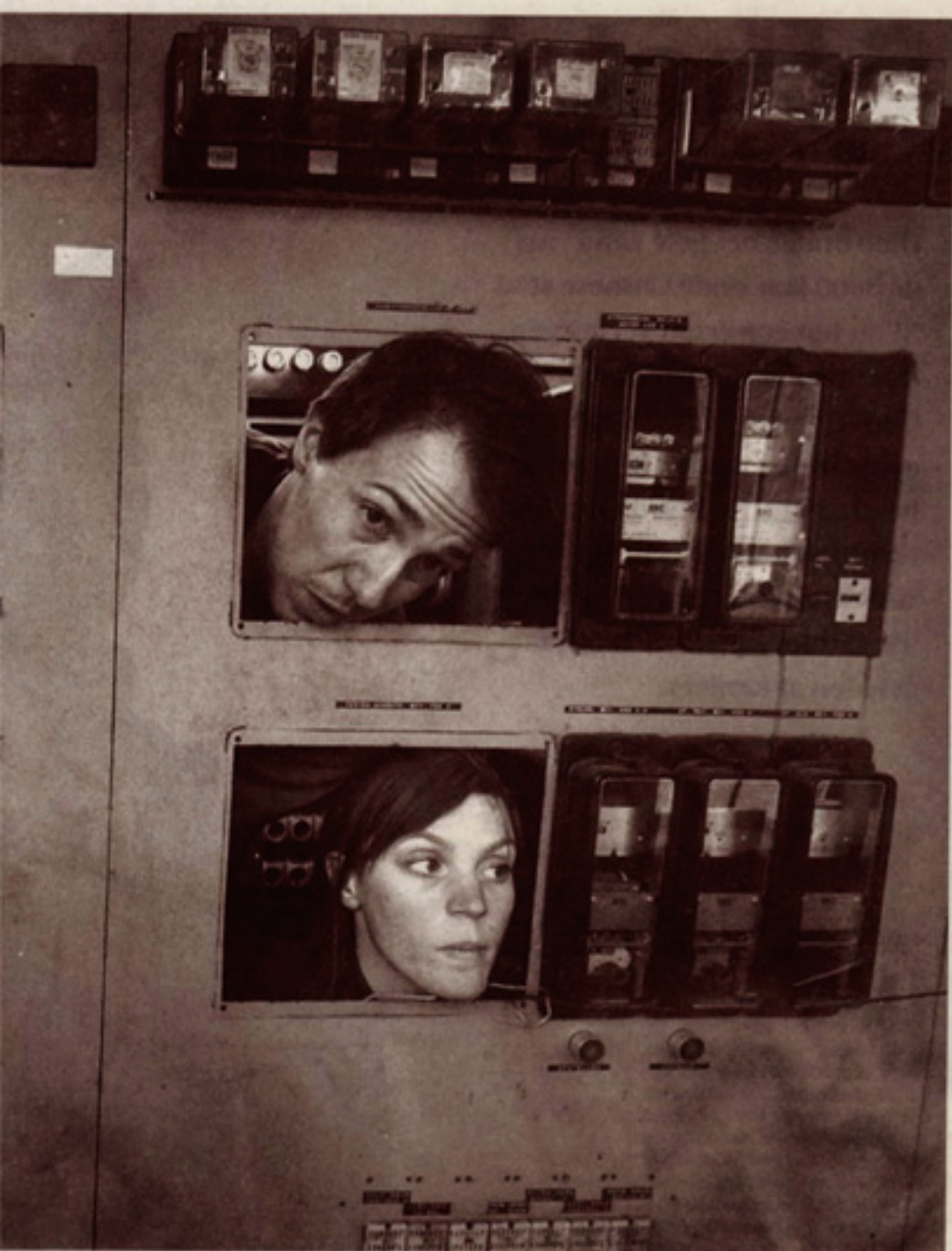
ingslaboratorium in Arnhem.