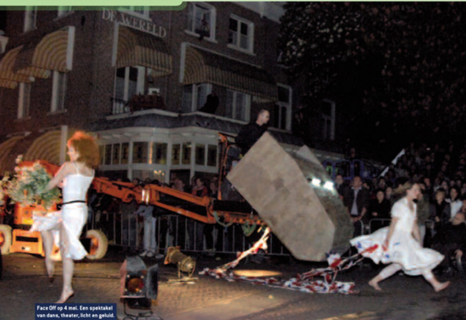
Face Off op 4 mei. Een spektakel van dans, theater, licht en geluid.

netwerk van zo'n twaalf freelancers en tientallen vrijwilligers. Munten wordt nog steeds beschouwd als de goeroe.